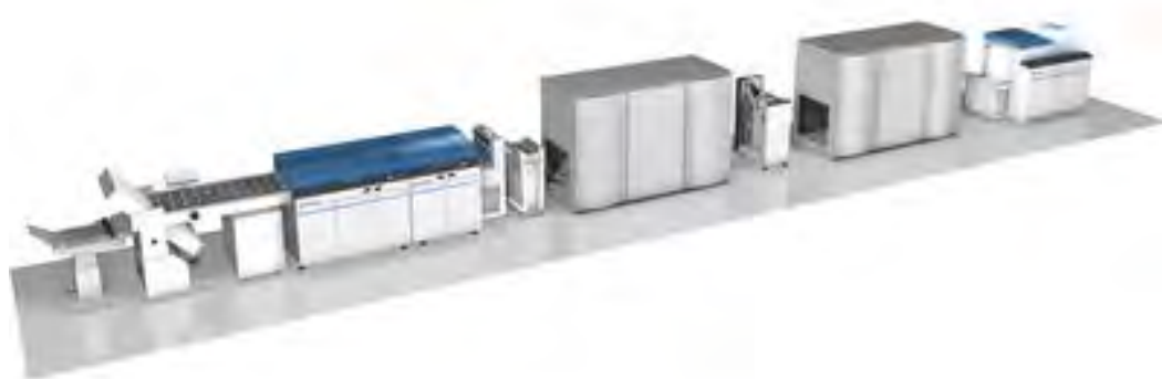
HUNKELER DIGITAL NEWSPAPER SOLUTION