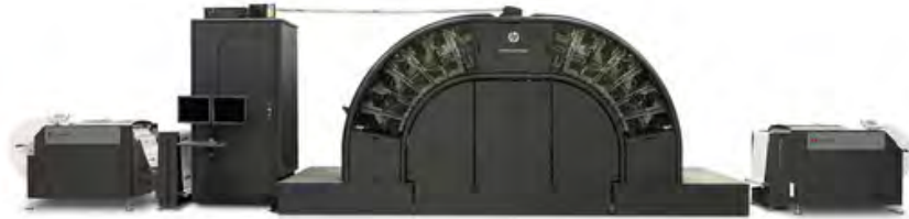
HP T 230