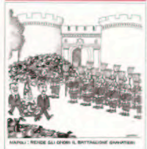
NAPOLI. REDEE GLI OREI IL BIRITANNICO GOVERNO

ROMA — Servono da 20 ai 30 miliardi di euro per arrivare al pareggio di bilancio nel 2011. È il cuore del piano triennale di stabilizzazione dei conti pubblici firmato da Giulio Tremonti. Per il ministro dell'Economia «esistono comunque dei rischi finanziari» e quindi decide di pigliare sul serio l'accelerazione. A giugno sono previsti tagli alle spese, e per primi verranno colpiti proprio i bilanci dei ministeri. Intanto ieri, con due decreti, il governo ha deciso l'annullamento dell'Ici sulla prima casa e la detassazione sugli straordinari e sui prezzi aziendali. ALL'APERTURA 2 e 3 Guerrieri, Semino e Tamburino A PAGINA 12