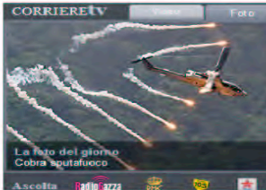
La foto del giorno Cobra spulataico