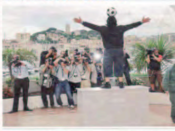
MARADONA ATTACCA PELÉ, SHOW A CANNES